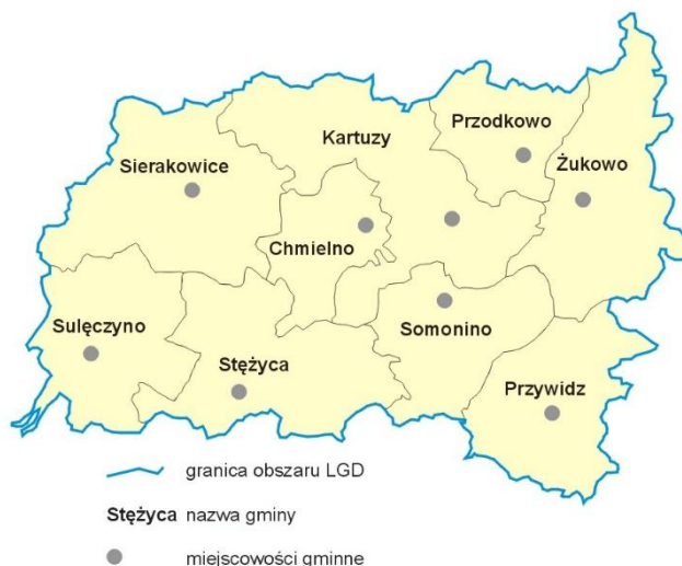
Rys 1. Mapa obszaru objętego LSR.

Poniżej wskazano mapę obszaru objętego LSR z zaznaczeniem granic poszczególnych gmin, która wskazuje jednoznacznie na spójność przestrzenną obszaru objętego LSR.